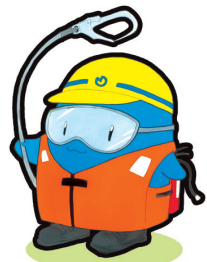
水ノ上災害防具マスコットキャラクター みずノン